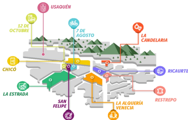
Imagen 1. Mapa del Programa Bogotá Corazón Productivo 2024.